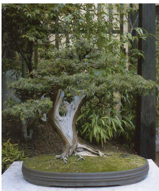
Рис.6. Можжевельник китайский

Джин подходит не для всех видов. Как правило, используются хвойные породы (можжевельник, ель, сосна, кедр, тис). Не подходят для джина породы с мягкой древесиной, склонной к гниению. При создании джина необходимо чувство меры, т.к. он может выглядеть искусственно и ухудшить впечатление. На этом китайском можжевельнике джин искусно имитирует старый возраст (рис.6.).