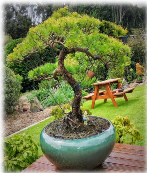
Рис.4.Экспонирование «бонсай» на специальной площадке

Оригинально смотрятся плодоносящие и цветущие деревья – бугенвиллия голая, гибискус гибридный, сагерция чайная, гуайява, гранат, фикус мелкоплодный, мирт обыкновенный, магнолия поддуболистная, слива, яблоня ягодная, айва японская, цитрусовые и др.