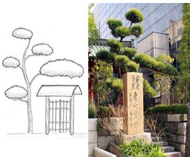
Рис.12. Стельниваки «Монкабури»

«Монкабури» – «покрывающий врата». Его формируют таким образом, чтобы одна нижняя ветка была очень длинной и располагалась горизонтально над входом в сад. Эта форма в Японии ассоциируется с культовыми сооружениями Тории (врата перед входом в храмы) и, так же как и Тории, считаются символом удачи и успеха (рис. 12).