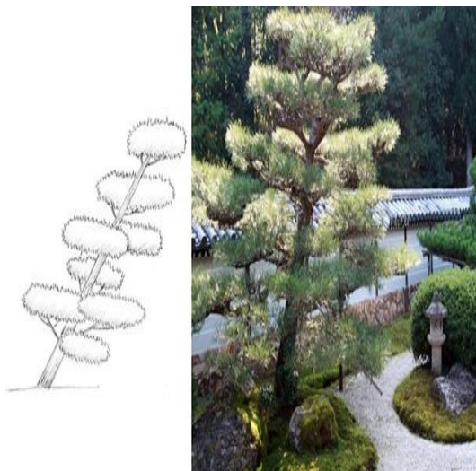
Рис.9. Сильниваки «Сякан»

«Сякан» (наклонный стиль) - мощный прямой или почти прямой ствол наклонен. Основная часть ветвей и корней направлена в одну сторону, символизирует сопротивление ветру(рис. 9.).