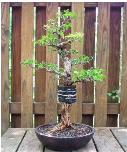
Рис. 5. Размножение бонсай, используя воздушные отводки

образования корневой системы. Воздушными отводками размножают - сирень, чубушник, калину, боярышник, сосну, ель и др. (рис. 5).