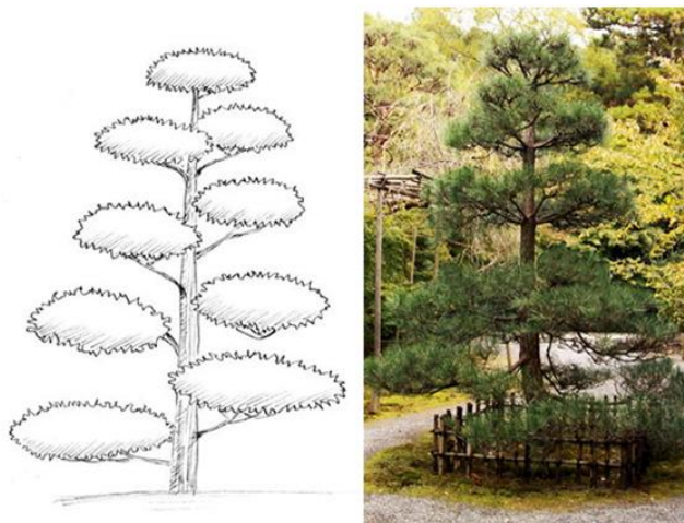
Рис.7. Сильниваки «Тёккан»

Классический стиль – «тёккан», в котором представлено одиночное дерево с мощным прямым стволом и равномерно направлены в разные стороны ветви и корни. Дерево символизирует негибаемую жизненную силу и гордое одиночество (рис. 7).