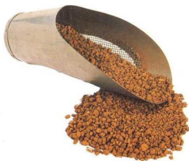
Рис.3. Глина разного размера

Глина имеет хорошую влагоемкость и может удерживать большое количество воды и питательных веществ. Для облегчения дренажа следует добиваться наличия в субстрате кусочков глины разного размера (рис. 3).