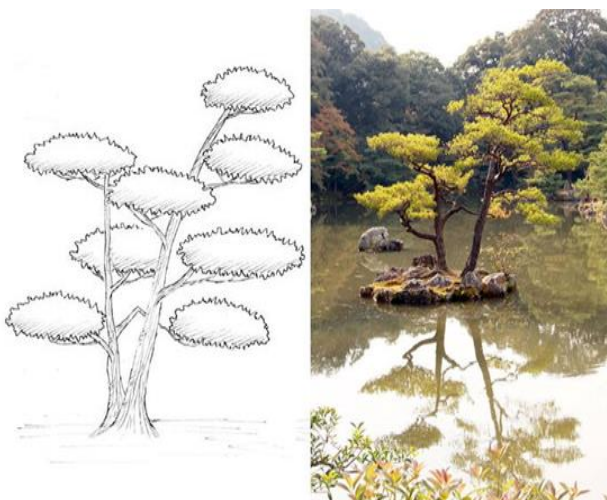
Рис.8. Силь ниваки«Сокан»

«Сокан» (стиль близнецы). Дерево формируется со стволом, раздвоенным максимально близко к земле. Часто ассоциируется с братьями или супружеской парой (рис. 8.).