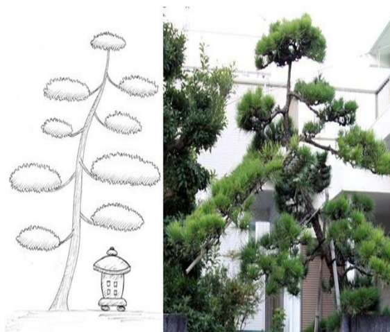
Рис.10. Сильниваки «Котобуки»

«Котобуки» – форма, похожая очертаниями на иероглиф «счастье». Высаживают в саду как дерево-оберег. Нижние ветви дерева должны прикрывать камень или каменный фонарь (рис. 10).