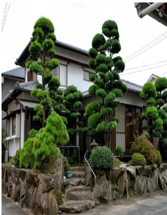
Рис.1. Территория, оформленная в японском стиле

Цели и задачи дисциплины, основные термины и понятия. История развития бонсай и ниваки в России. Создание композиций из хвойных, вечнозеленых, листопадных и плодовых растений. Теория и практика выращивания деревьев в стиле бонсай и ниваки.