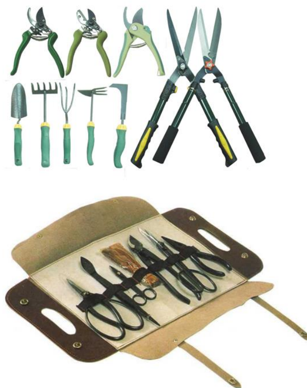
Рис. 2. Набор инструментов и принадлежностей при формировании деревьев в стиле бонсай и ниваки

Группа инструментов и принадлежностей при формировании деревьев в стиле бонсай и ниваки. Секатор, стандартные ножницы для бонсай, длинные ножницы для тонких побегов, ножницы для обрезки листьев, сферические кусачки, пинцет с лопаткой, большая складная пила, тонкая пилка, прививочный нож в деревянных ножнах, крюк для корней, малый рыхлитель для корней, серп-пила, кусачки для корней, мощные стандартные ножницы для обрезки корней, плоскогубцы для джинов / проволоки, большие кусачки для проволоки, малые кусачки для проволоки, (средний) набор совков для почвы и др. (рис. 2.).